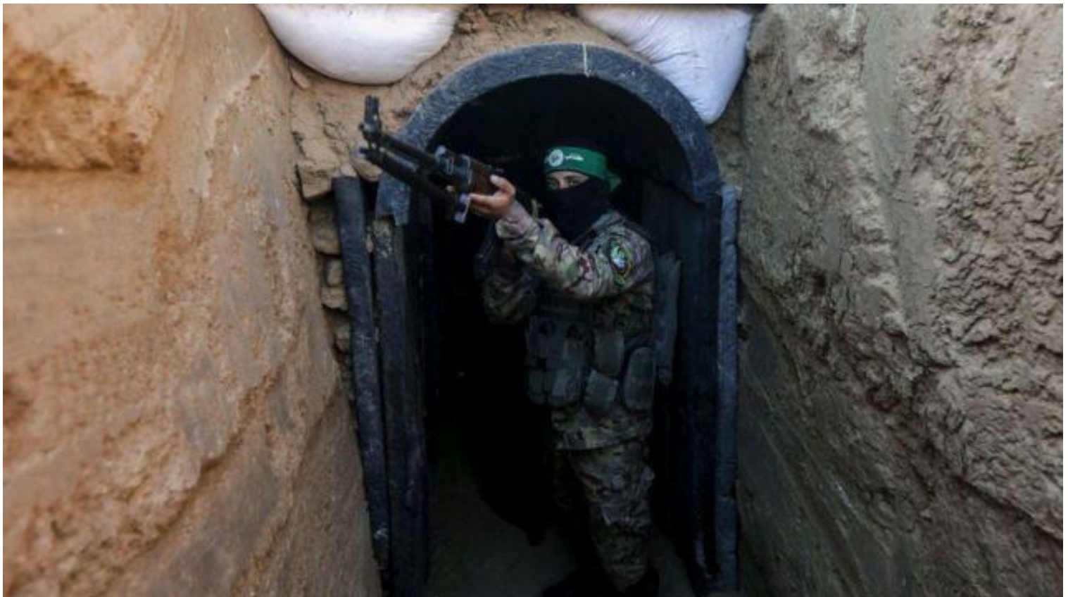
Địa đạo của Hamas ở Gaza