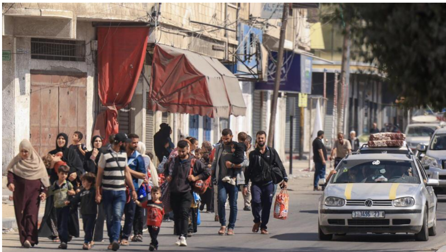
Người dân Palestine tại dải Gaza di tản ngày 13/10/2023.

dân Palestine phải di tản về phía nam dải đất này. Lệnh di tản, giống như một tối hậu thư, đã bị Liên Hiệp Quốc phản đối, nhưng Tel Aviv không lùi bước.