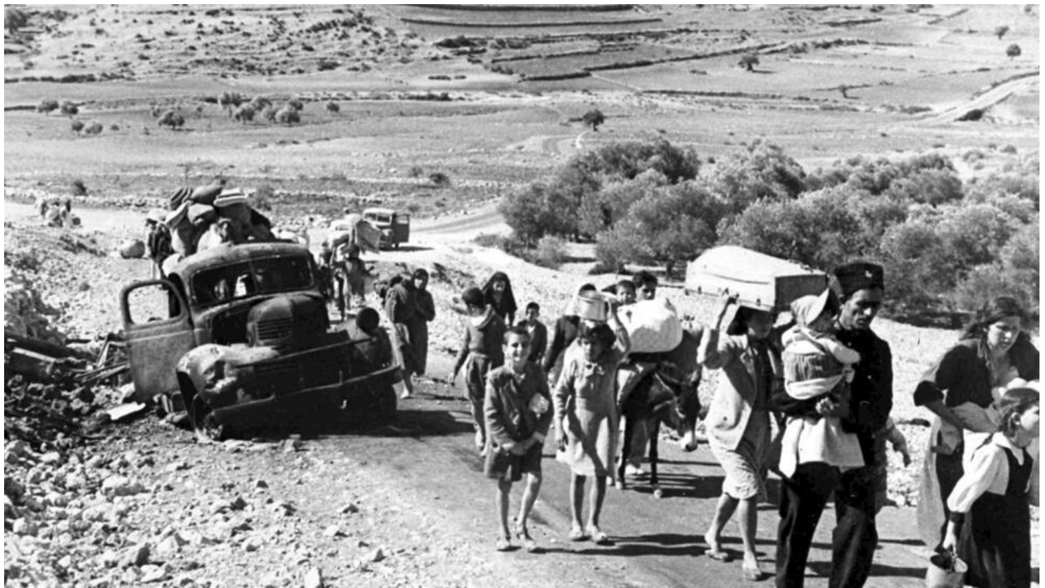
Ảnh chụp ngày 09/11/1948 : Đoàn người Palestine chạy tị nạn sang Liban vì cuộc chiến tranh Israel - Ả Rập 1948.