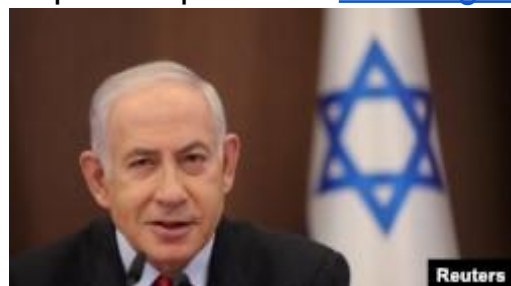
Thủ tướng Israel Benjamin Netanyahu.