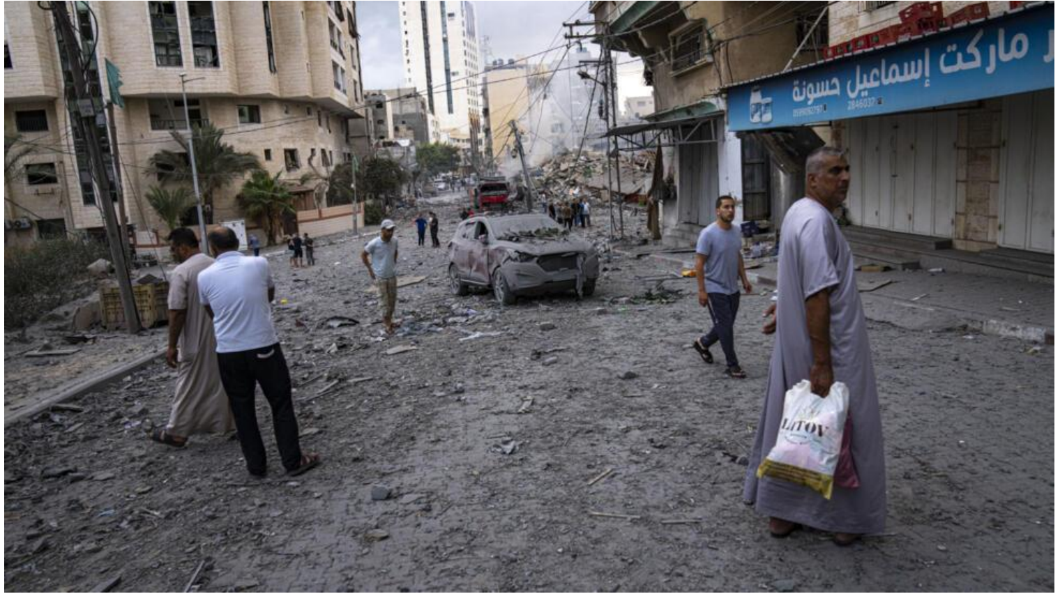
Một khu phố đổ nát ở gần trung tâm Gaza sau trận oanh kích của Israel, ngày 10/10/2023.

mất cửa ở dải Gaza do bị quân đội Israel bao vây và pháo kích từ 4 ngày qua. Số người thiệt mạng tiếp tục gia tăng từ cả hai phía. Chính quyền Israel khẳng định không cho phép vận chuyển bất cứ loại nhu yếu phẩm nào vào khu vực có hơn 2 triệu sinh sống, cho đến khi nào Hamas thả các con tin.